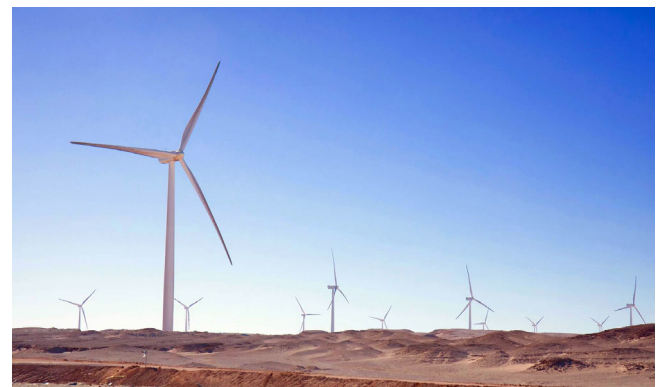
500 MW BOO Gulf of Suez 2 Windpark, Ägypten, 2018 – 2025