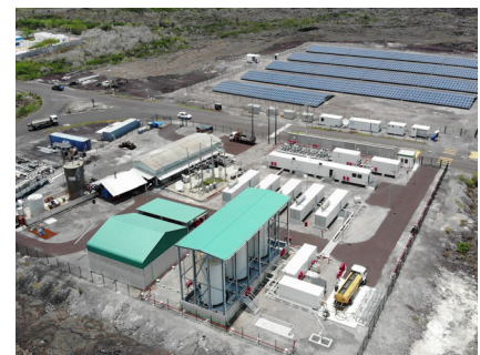
Hybridanlage Jatropa / Diesel & PV & BESS, Galapagos, Ecuador, 2010 – 2021