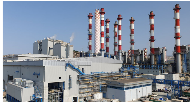
868 MW Kombikraftwerk Vasilikos, Zypern, 2019 – laufend

Lahmeyer International ist ein weltweit tätiges Ingenieurunternehmen mit einem umfassenden Portfolio an unabhängigen Ingenieur-, Planungs- und Beratungsdienstleistungen. Unser Fokus liegt auf komplexen Infrastrukturprojekten in den Bereichen Energie sowie Wasser und Wasserkraft.