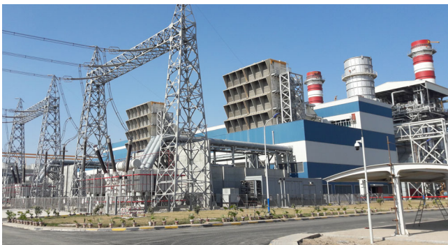
Drei Gas- und Dampf-Kombikraftwerke (GuD) Balloki, Haveli Bahadur Shah und Bhikki, Pakistan, 2015 – 2018. Einer der weltweit höchsten Wirkungsgrade von 63 % wird im GuD Haveli Bahadur Shah mit H-Klasse Gasturbinen erzielt.