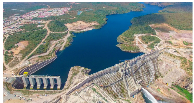
2.070 MW Wasserkraftanlage Laúca, Angola, 2013 – 2024