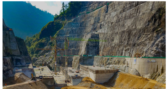
140 MW Wasserkraftanlage Tanahu, Nepal, 2015 – 2027