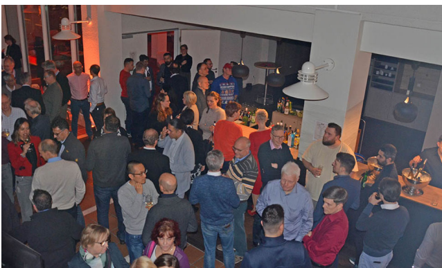
Lahmeyer Weihnachtsfeier 2024