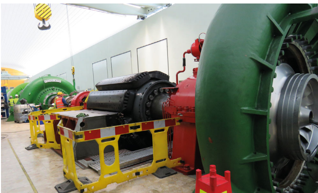
160 MW Pumpspeicherwerk Happurg, Rehabilitation, Deutschland, 2020 – 2023