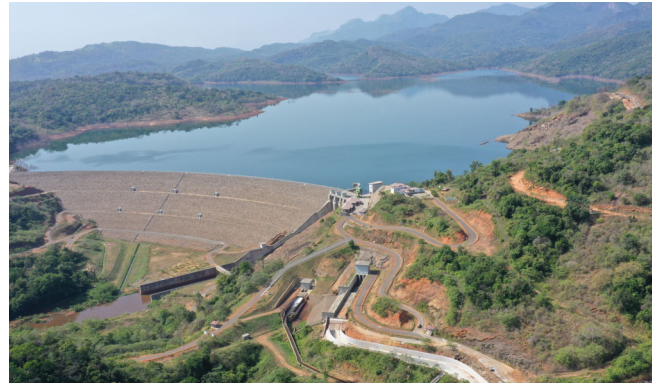
Stärkung der Bewirtschaftung der Wasserressourcen Mahaweli, Sri Lanka, 2015 – laufend; 103.000 ha Bewässerung und 162 MCM Trinkwasser