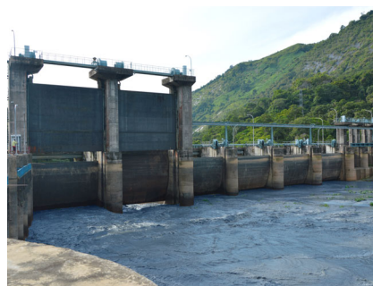
270 MW Wasserkraftanlage Bakaru I & II, Indonesien, 2020 – 2023