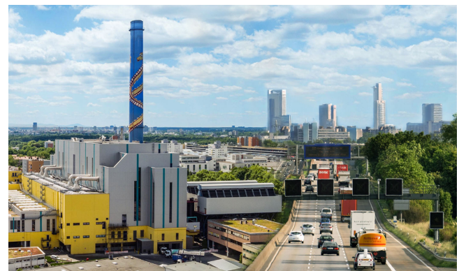
MH2Regio, Wasserstoff aus Abfall, Frankfurt a.M., Deutschland, 2020 – 2021; Planung regionaler Wasserstoff-Infrastruktur, u.a.