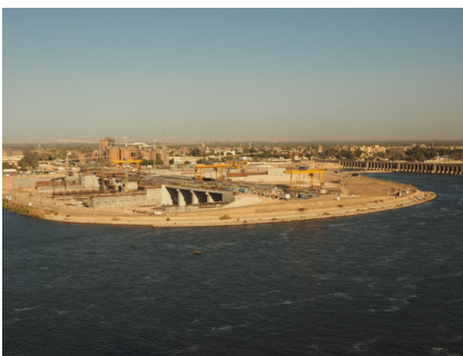
Neues Assiut Stauwehr und Wasserkraftanlage, Ägypten, 2008 – 2018