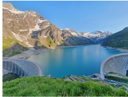
480 MW Pumpspeicherwerk (PSW) Limberg III, Österreich, 2020 – 2024