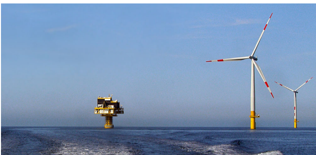
Offshore Wind & Wellen Energiepotenzial-Analyse, Türkei, 2019