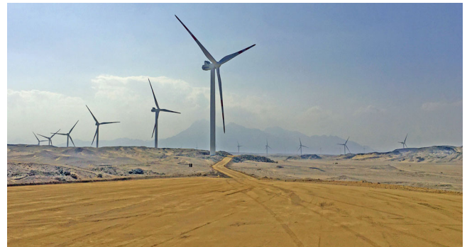
252 MW Gulf of Suez 1 Windpark, Ägypten, 2018 – 2026; (windfarm-gos1-egypt.de)

Seit 1966 hat unser Know-how zur erfolgreichen Umsetzung unzähliger Projekte in über 160 Ländern beigetragen. Die Wurzeln unseres Unternehmens reichen bis ins Jahr 1890 zurück.