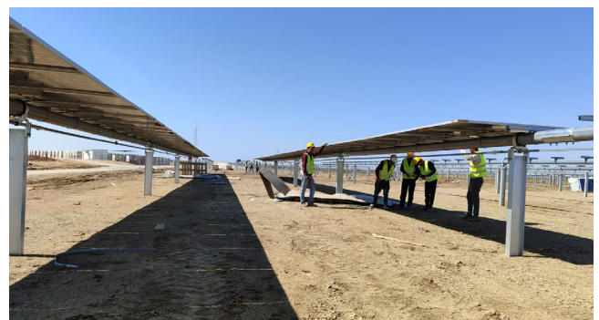
100 MW Kairouan Photovoltaik-Anlage, Tunesien, 2023 – 2025