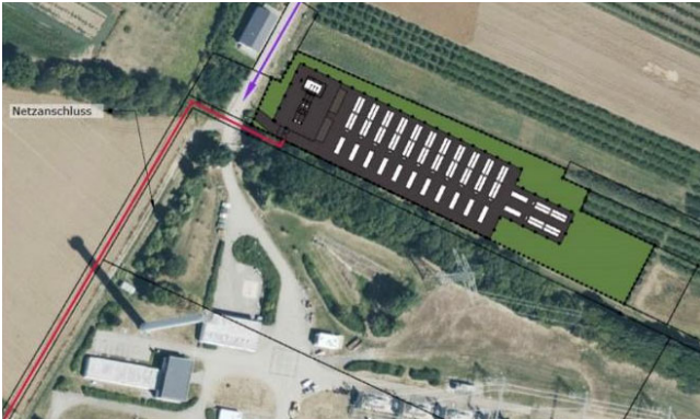
50 MW/100 MWh Batteriespeicher Weißenthurm-Kettig, Deutschland, 2024 – 2027