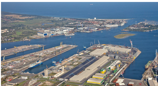
HyTech Hafen Rostock, Rostock, Deutschland, 2023 – 2024; 100 MW Elektrolyse-Anlage an existierendem Kohlekraftwerk in Rostock.