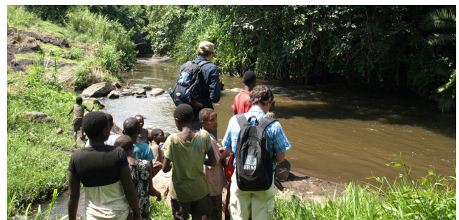
Kollegen am Lower Nsongya River, West Nile Region, Uganda; Zehn 1-20 MW Projekt-Pakete aus Erneuerbaren Energien, Kleinwasserkraft u.a.