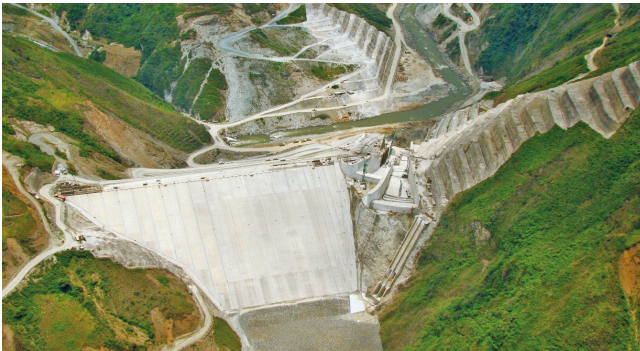
1.375 MW Wasserkraftanlage Mentarang, Indonesien, 2023 – laufend